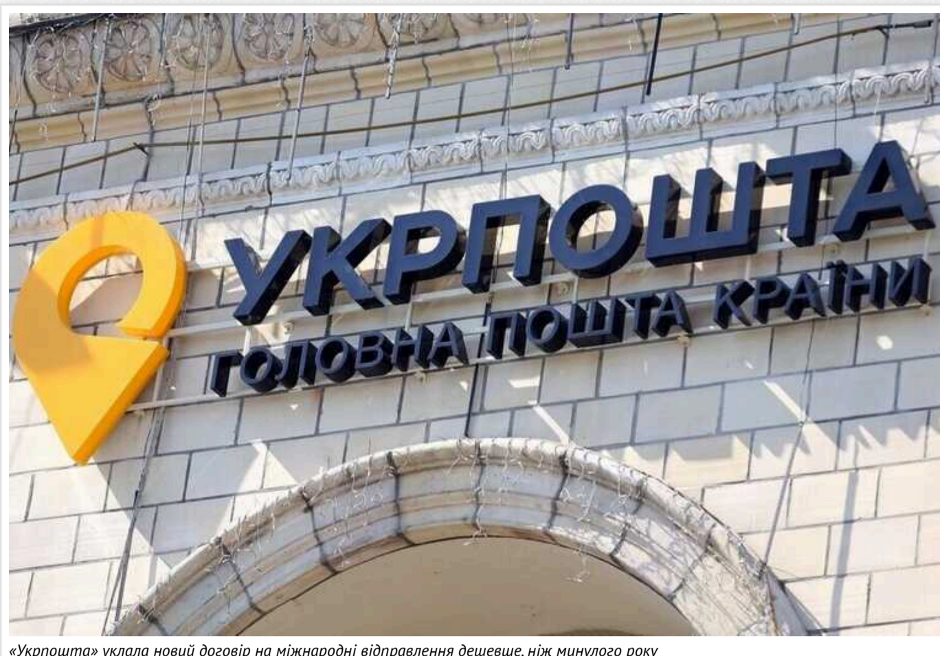
«Укрпошта» уклала новий договір на міжнародні відправлення дешевше, ніж минулого року

АТ «Укрпошта» 8 лютого уклала угоду з ТОВ «Норді» на послуги міжнародних перевезень вантажу у цьому році вартістю 356,68 млн грн.