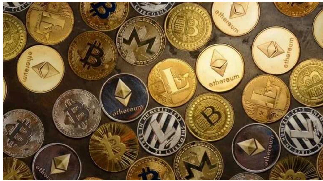
З'явився список українських криптомільйонерів-політиків: 1428 декларацій чиновників

Кількість декларацій, в яких задується криптовалюта, росте рік до року. Понад 1,4 тисячі таких декларацій було подано за 2022 рік.