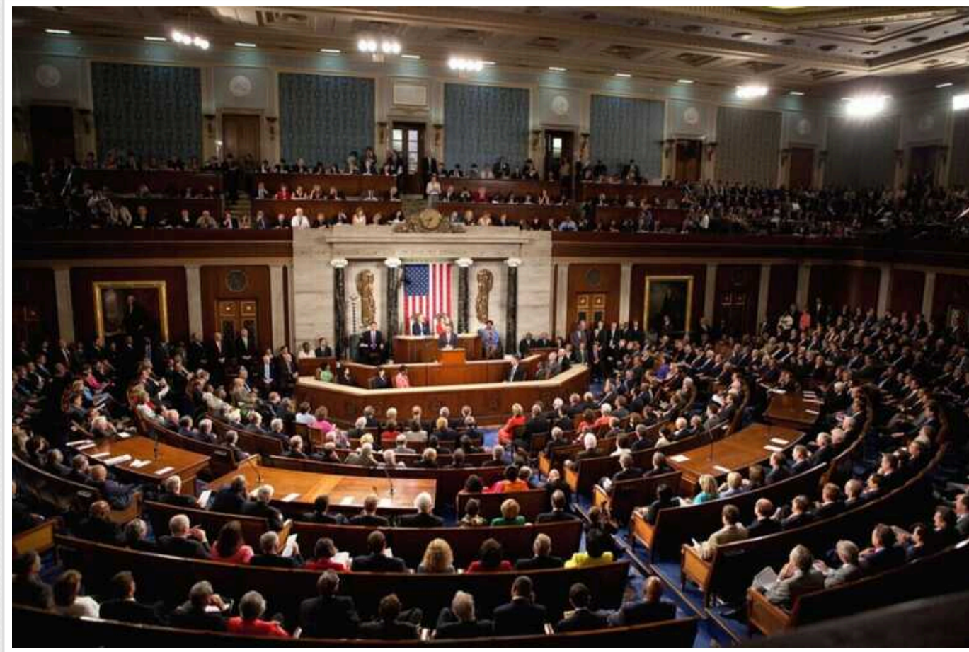
У США Сенат зробив новий крок до ухвалення законопроекту про допомогу Україні

Прошло процедурне голосування, під час якого 67 сенаторів (серед них – 18 республіканців) проти 27 проголосували за продовження розгляду документа.