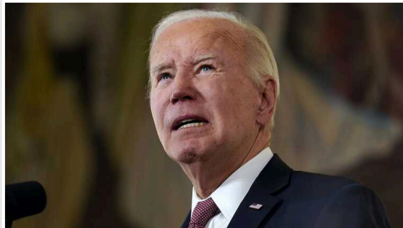
86% американців вважають, що Байден вже надто поважного віку для 2-го терміну

Переважна більшість американців вважають, що чинний президент Джо Байден вже надто поважного віку для того, щоб балотуватися на другу каденцію.