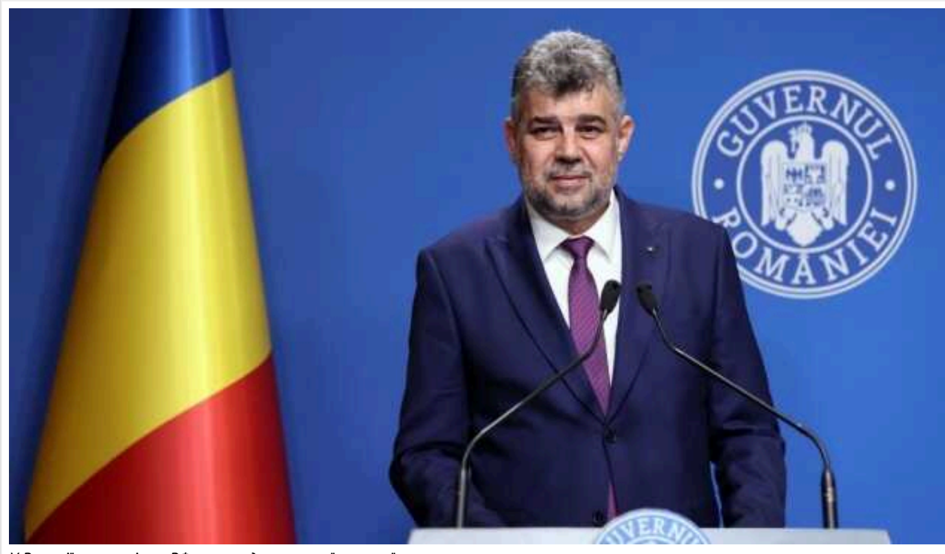
У Румунії впевнені, що РФ не нападатиме на їхню країну

Румунський прем'єр Марсел Чолаку заявив, що РФ не здійснювала цілеспрямованих нападів на країну і не робитиме цього в майбутньому.