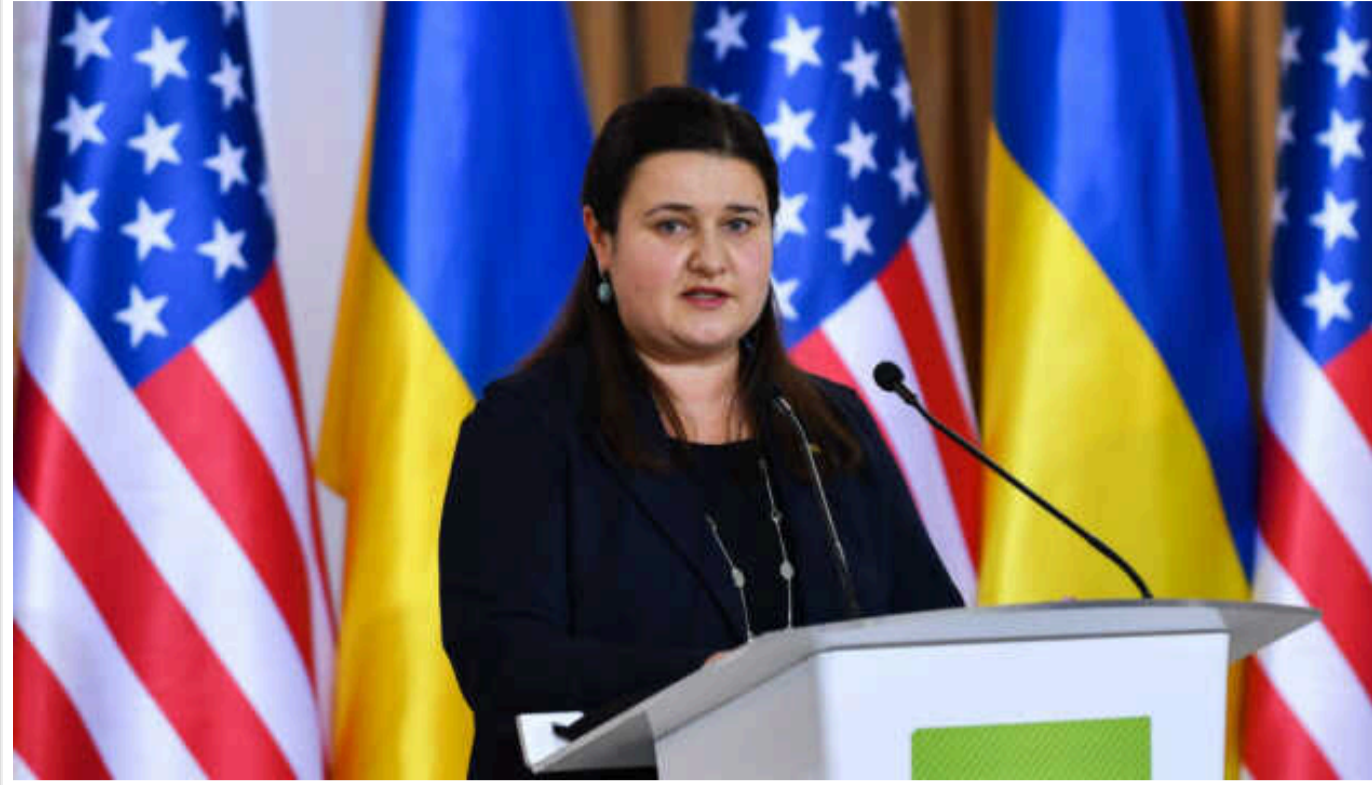
Посол України пояснила, як буде далі рухатися проєкт з допомогою України у Сенаті США

У понеділок Сенат США може зробити наступний крок до схвалення великого пакетного проєкту з коштами на допомогу для України.