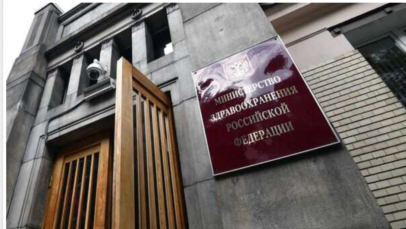
Через війну в Україні РФ зіштовхнулась з браком медпрацівників, – розвідка Британії

Збройна агресія Росії в Україні призвела до дефіциту медичних працівників по всій території країни-окупанта. Після мобілізації лікарів у деяких регіонах РФ постала гостра нестача медичного персоналу.