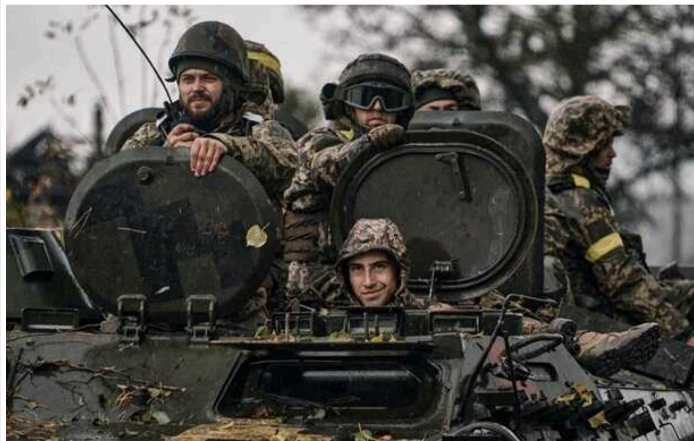
Ситуація на фронті: на Бахмутському напрямку Сили оборони відбили 19 атак противника

Минулої доби росіяни атакували на 8 напрямках, найактивніше на Мар'їнському та Авдіївському, загалом на фронті відбулося 100 бойових зіткнень; окупанти завдали 4 ракетних та 110 авіаційних ударів, здійснили 95 обстрілів з реактивних систем залпового вогню по позиціях українських військ та населених пунктах.