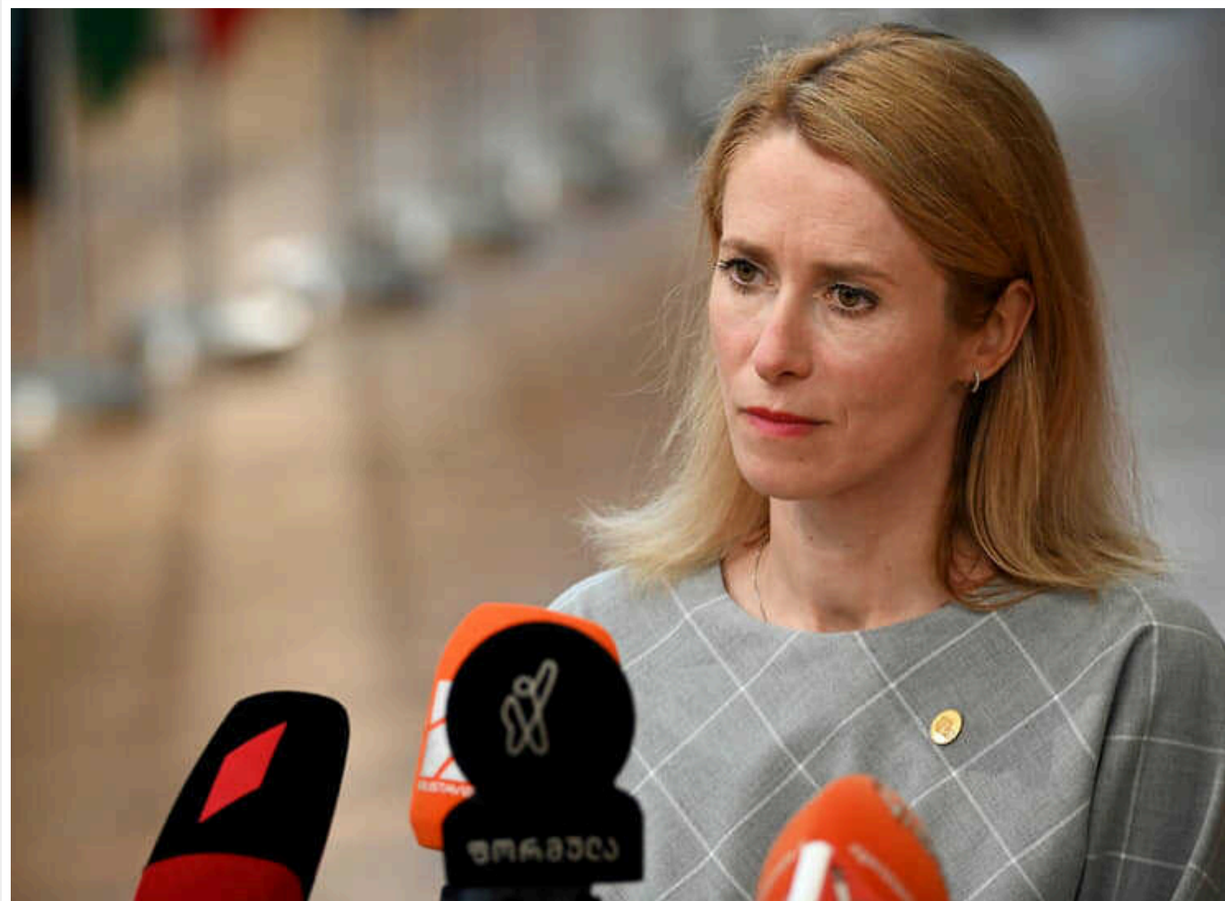
Прем'єрка Естонії розповіла про "пастки" у війні Росії проти України

Російська Федерація готується до тривалої загарбницької війни проти України, й агресія триватиме доти, доки у Кремлі не усвідомлять свою нездатність здобути перемогу.