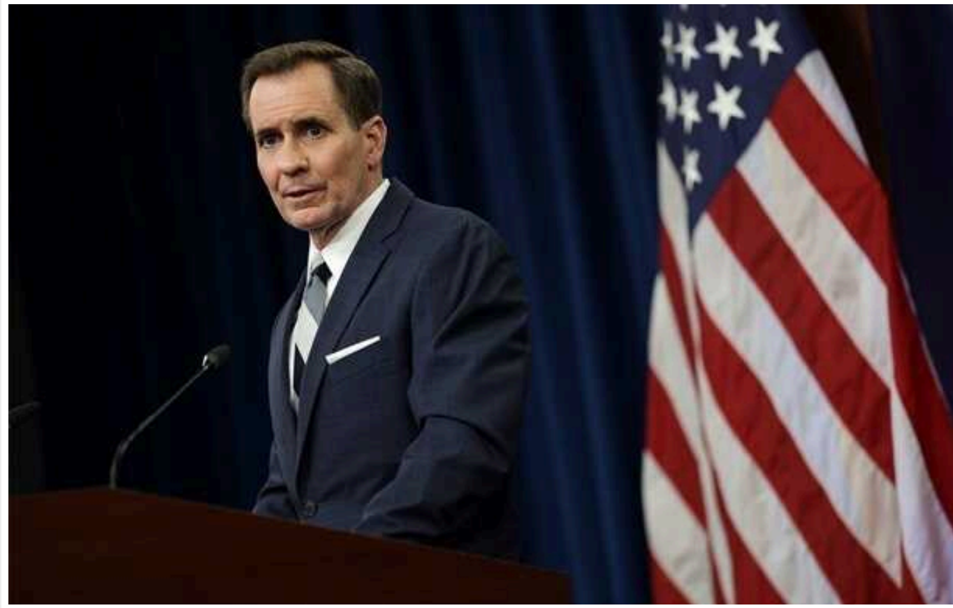
Reuters: Джон Кірбі отримає нову посаду

Координатор зі стратегічних комунікацій Ради нацбезпеки Білого дому Джон Кірбі отримає нову посаду та розширення повноважень.