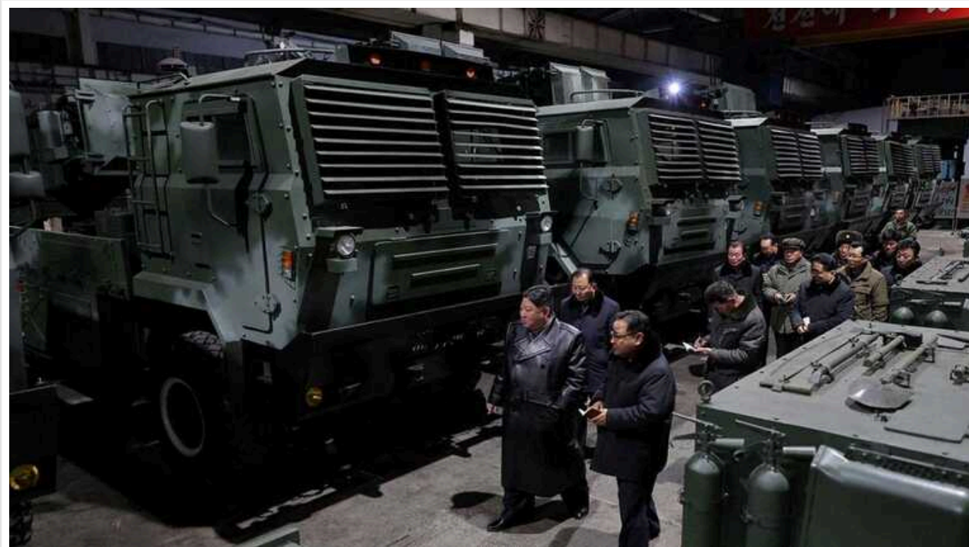
Північна Корея заявила про розробку нових керованих снарядів для ракетної пускової установки

Північна Корея розробила нову балістичну систему керування реактивною системою залпового вогню і керовані снаряди.