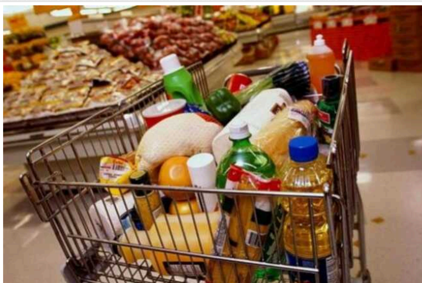
В Україні дорожчають продукти: полуниця по 1000 гривень, а цибулі на весну може не бути

Картопля коштує вже вчетверо дорожче, ніж рік тому.