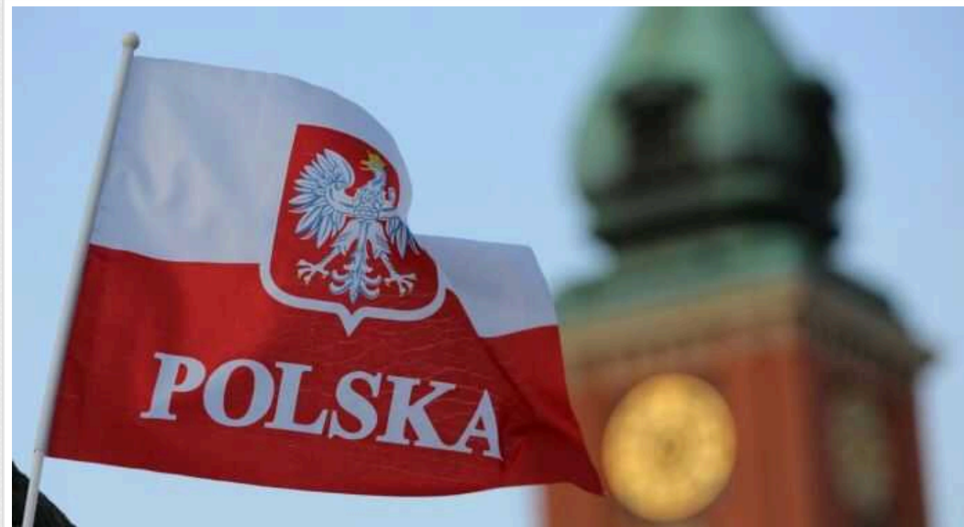
Дуда та уряд Польщі розійшлися у реакціях на розповіді Трампа про залякування союзників

Уряд Польщі та президент розійшлися в думках у своїй реакції на скандальні слова Дональда Трампа про те, що він погрожував комусь із лідерів союзників "заохотити Росію до агресії", та розкритикували одне одного.