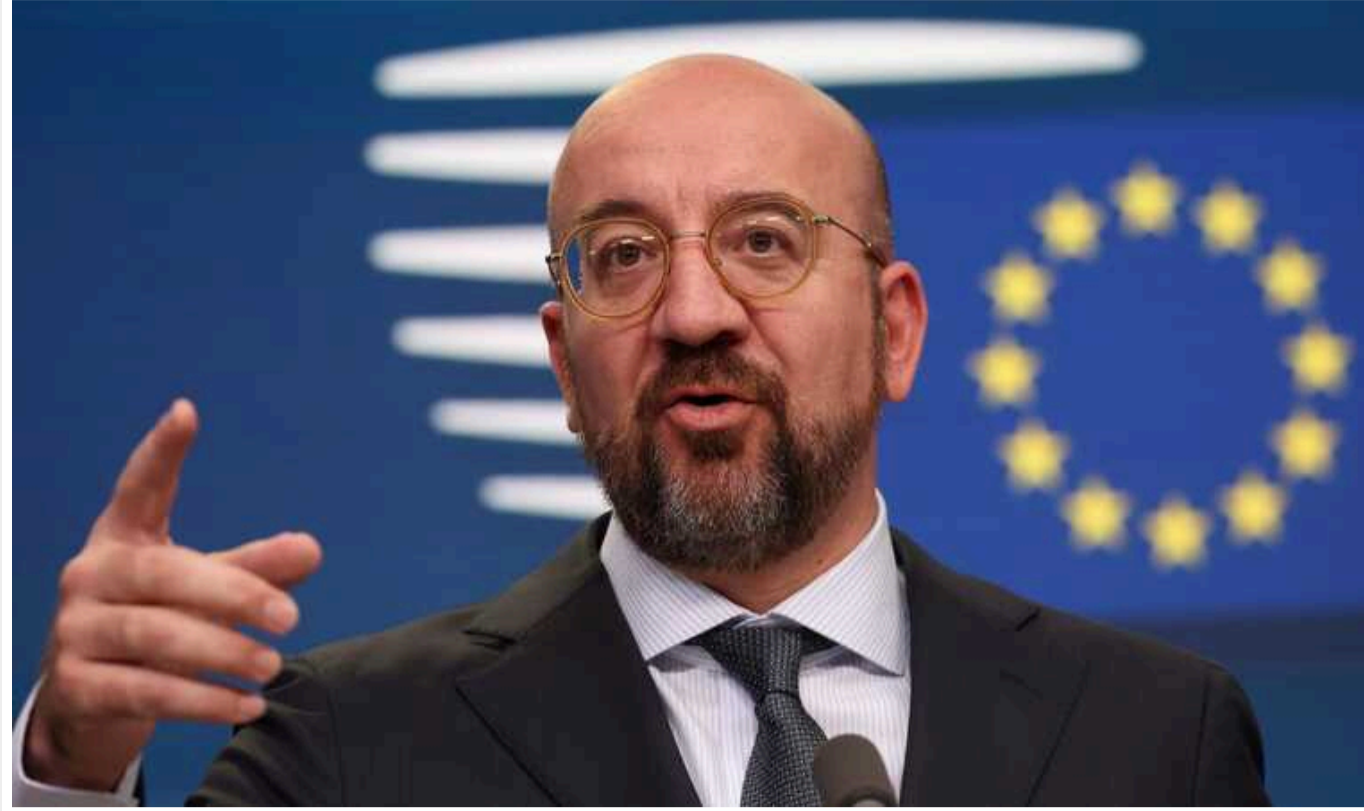
Голова Євроради прокоментував заяви Трампа: служитиме інтересам Путіна

Голова Євроради Мішель наголосив, що погрози 45-того президента США Дональда Трампа наголошують на необхідності для ЄС терміново розвинути свою стратегічну автономію.