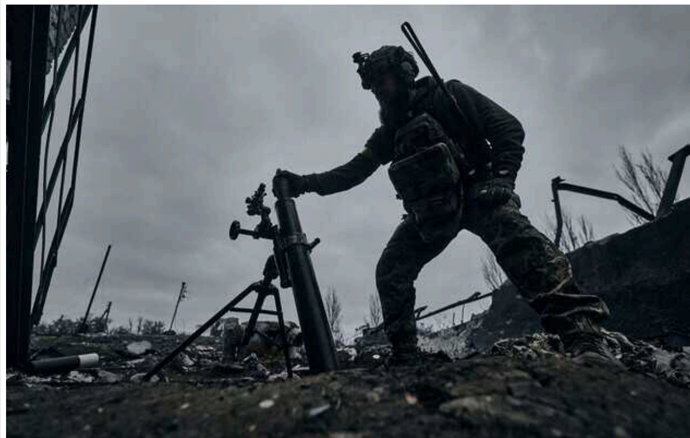
Ситуація на фронті: Протягом доби відбулось 95 бойових зіткнень

Російські окупанти продовжують спроби наступу на Куп'янському та Авдіївському напрямках. Водночас українські військові продовжують утримувати позиції на лівому березі Херсонської області.