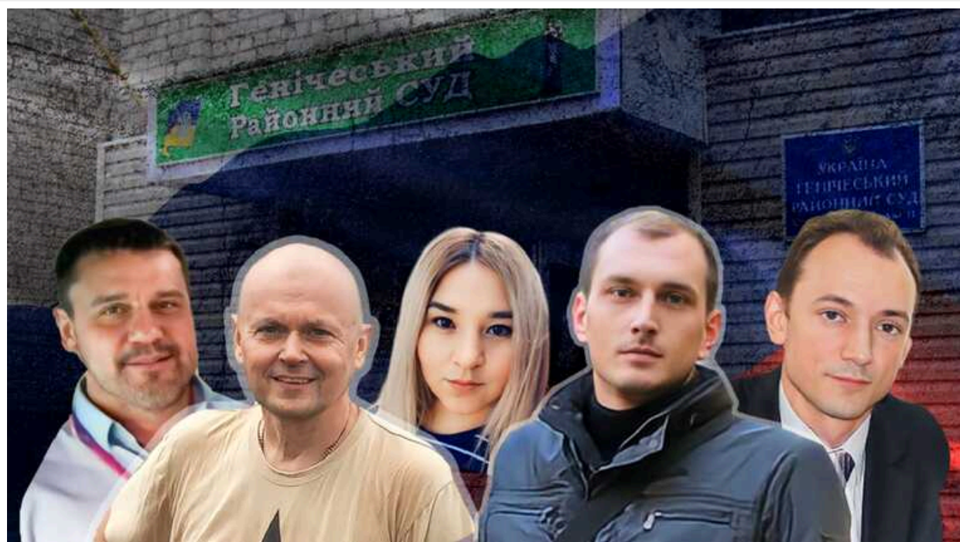
Хто пішов працювати до "судів" російських загарбників на окупованій Херсонщині

Після незаконних "референдумів" на новоокупованих територіях України почали формувати так звані регіональні представництва органів російської влади. Зокрема, створювати російські суди.