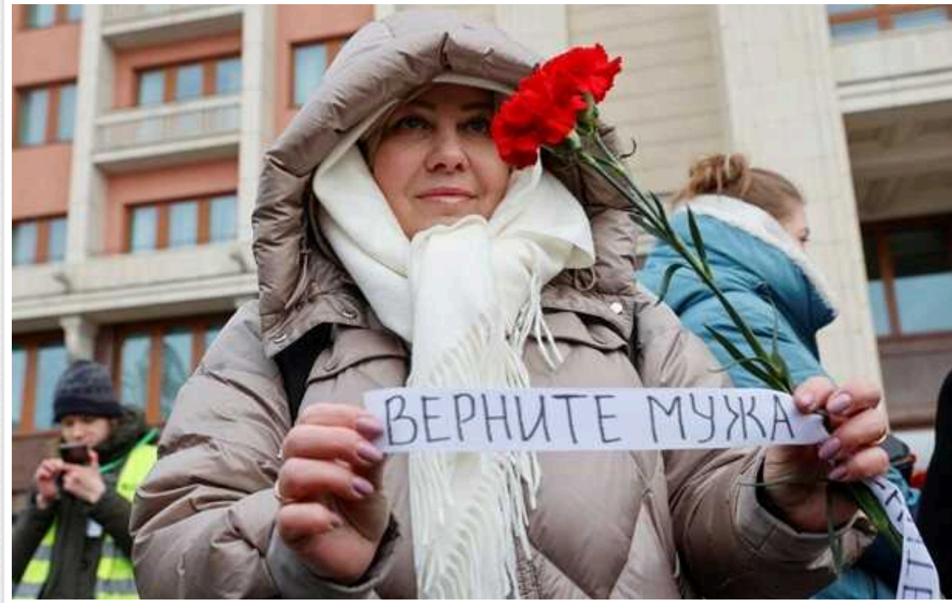
У РФ не вщухають протести родичів мобілізованих – ISW

Родичі російських окупантів продовжують вчиняти спроби "протестів" у різних містах РФ. Раніше Кремль цензурував подібні протести і придушив будь-яке можливе відродження ширшого громадського руху на підтримку мобілізованих.