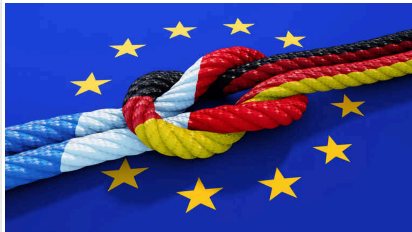
У Німеччині та Франції закликали Євросоюз бути готовим до нападу РФ

У Європі останнім часом все частіше порушується тема загрози нападу Росії на країни-члени Європейського Союзу. Щодо цього зокрема висловилися чиновники, політики та воєначальники з Франції та Німеччини. Вони закликають держави ЄС бути готовими до можливої агресії проти них з боку РФ.