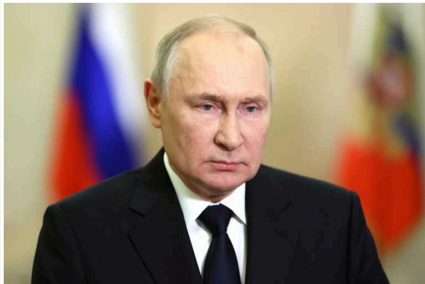
WSJ пояснила, навіщо Кремлю потрібні теорії про хвороби, смерть і двійників диктатора

Заяви російського політолога та професора Валерія Солов'я та публікації у зв'язаному з ним телеграм-каналі "Генерал СВП" про стан здоров'я Путіна та його оточення активно цитують західні таблоїди.