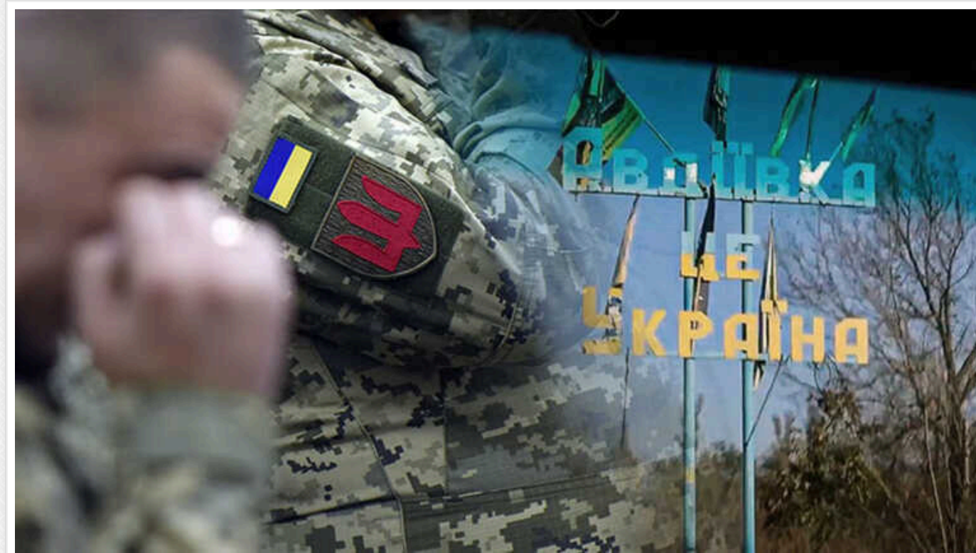
В Авдіївці вступили в бій свіжі сили ЗСУ, – Тарнавський

Про це повідомляє у своєму ТГ-каналі командувач оперативного-стратегічного угруповання військ «Таврія» Олександр Тарнавський.