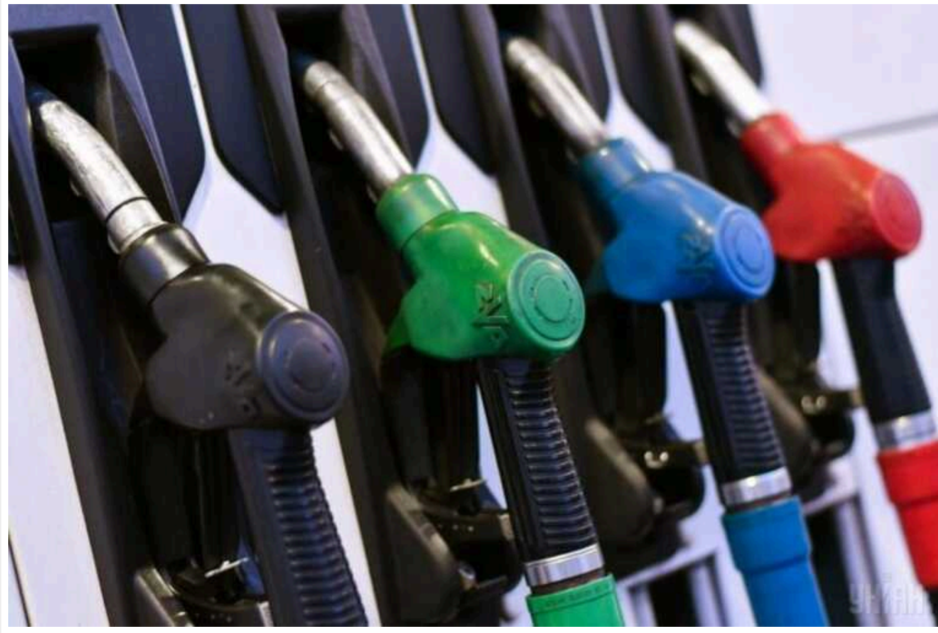
В Україні може помітно подорожчати дизельне паливо

У 2024 році у світі можуть різко збільшитись ціни на дизельне паливо.