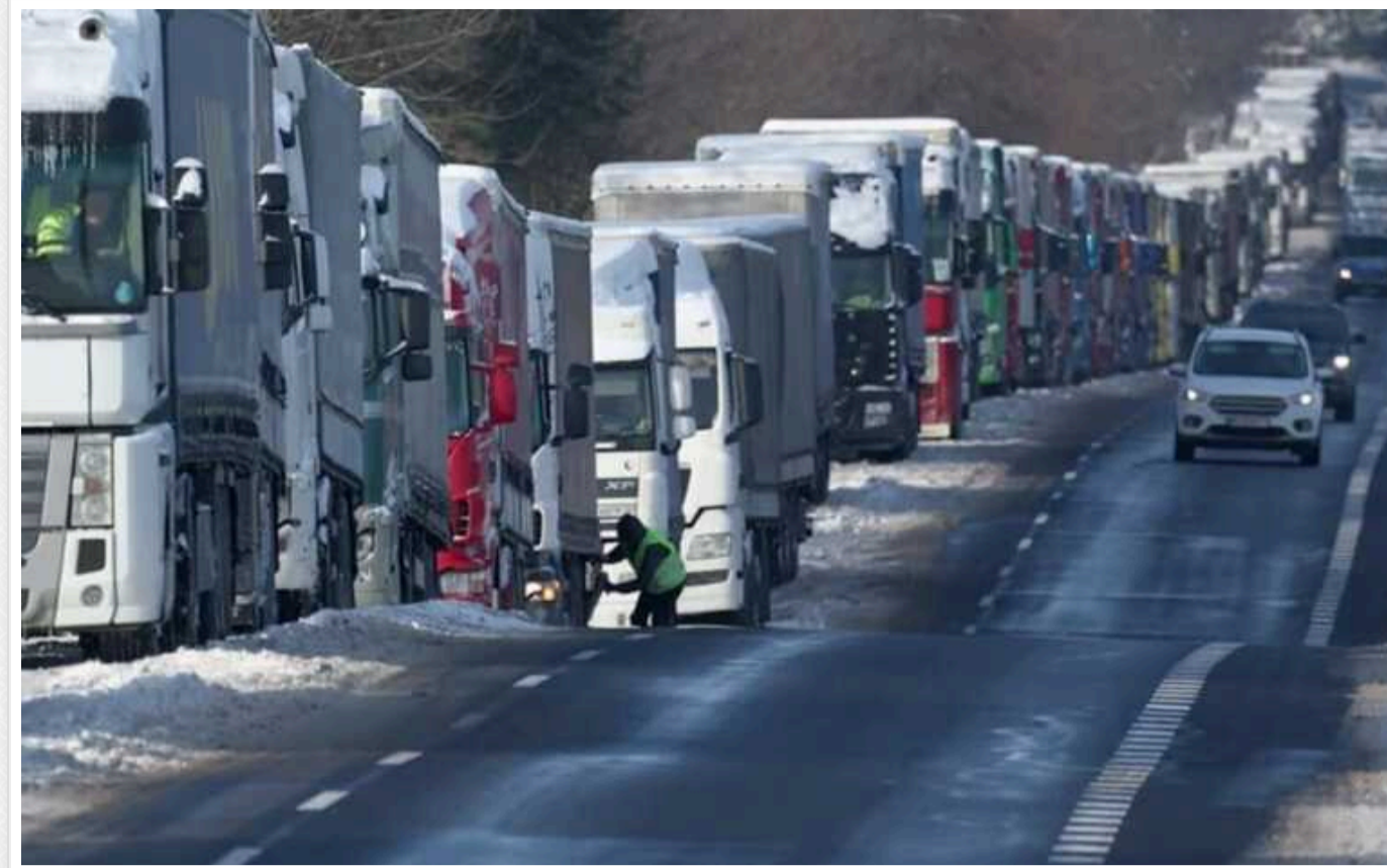
Польські протестувальники почали висипати зерно з українських вантажівок, що стоять на кордоні

Польські протестувальники висипають зерно з українських вантажівок. Це відбувається на пункті пропуску "Ягодин – Дорогуськ".