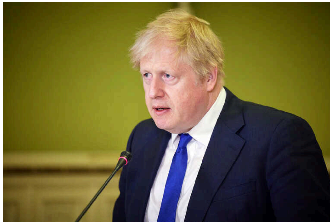
Це все було просто за сценарієм Гітлера, – Борис Джонсон про інтерв'ю Путіна Карлсону

Колишній прем'єр-міністр Великої Британії Борис Джонсон розкритикував Такера Карлсона за його "сміхотворне інтерв'ю" з кремлівським диктатором Володимиром Путіним. Він заявив, що Карлсон "зрадив своїх глядачів" у всьому світі.