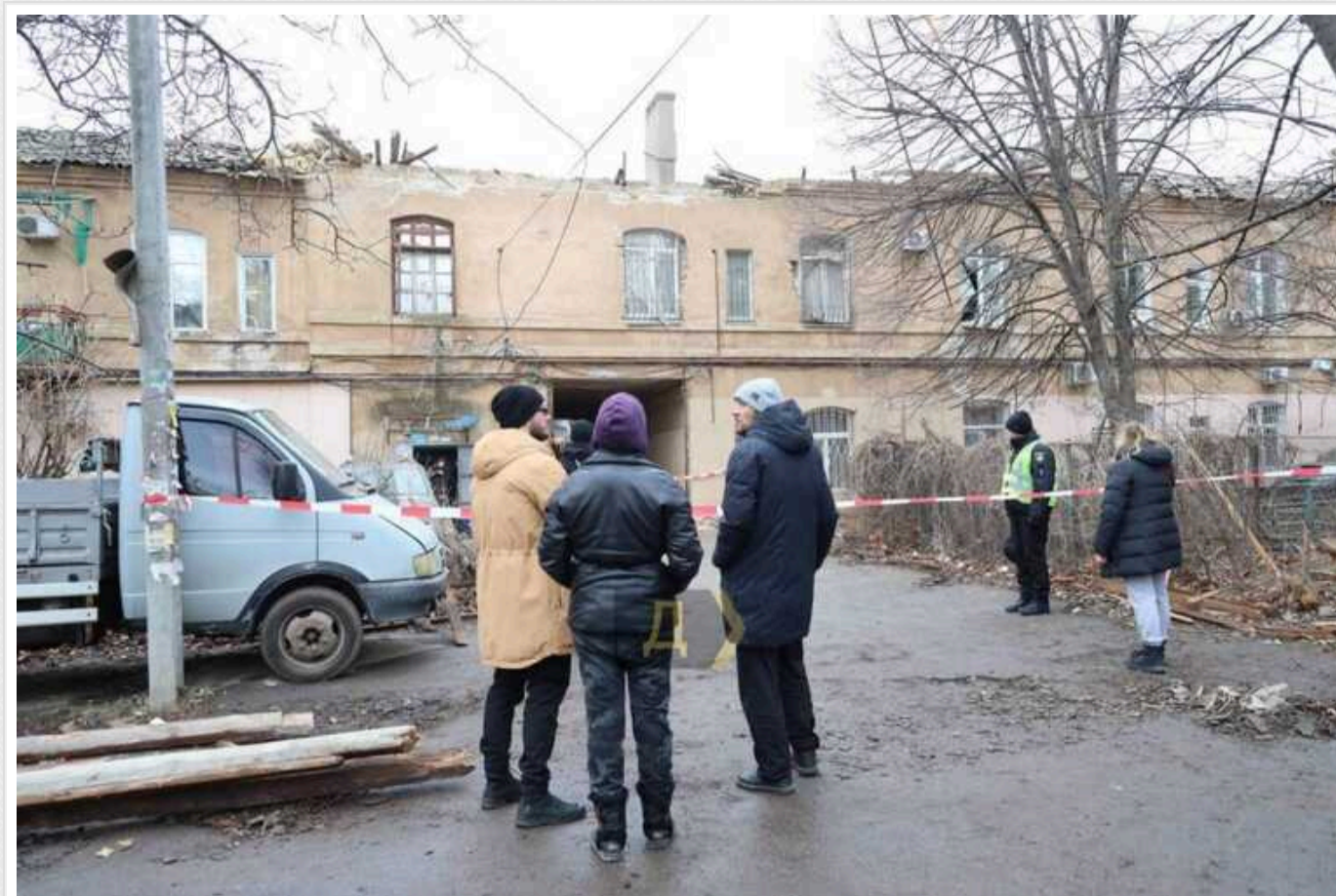
Атака на Одесу російськими БПЛА могла відбутися через виток секретної інформації, – ДБР

ДБР розпочало розслідування обставин атаки Одеси російськими дронами, яка відбулася 24 січня 2024 року. За версією слідчих до атаки можуть бути причетні українські військові, через недбалість яких відбувся витік інформації.