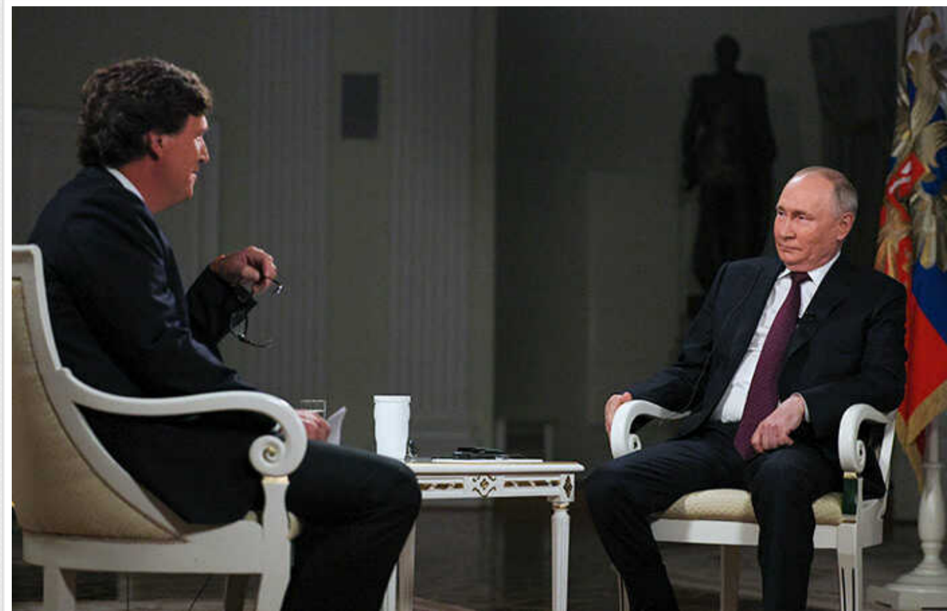
Китайці після інтерв'ю Путіна зажадали повернути назад Владивосток

Після абсурдного інтерв'ю російського диктатора Володимира Путіна американському журналісту Таєру Карлсону громадяни Китаю висунули країні-терористу Росії територіальні претензії. Зокрема, китайці вимагали повернути назад Владивосток.