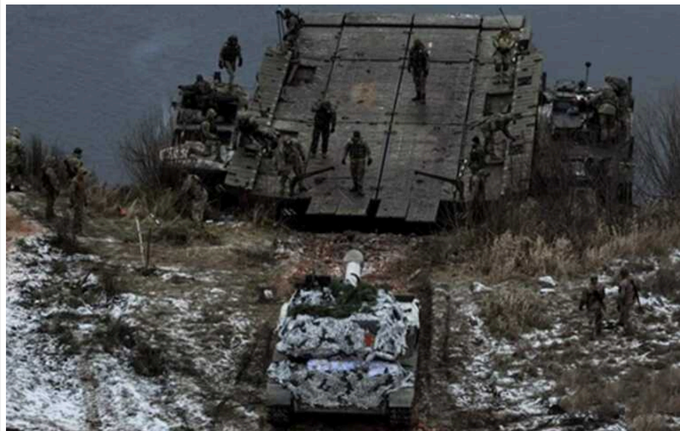
Полковник запасу оцінив перспективи розширення плацдарму ЗСУ на лівобережжі Дніпра

Перспективи подальшого розширення плацдарму українських військ на лівобережжі Дніпра в Херсонській області залежать від логістики. Для цього необхідний стабільний логістичний зв'язок між двома берегами через річку.