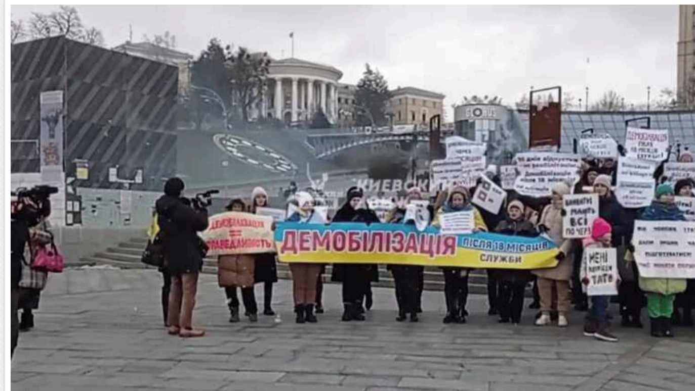
У Києві сім'ї військових вкотре вийшли на мітинг: вимагають демобілізувати їхніх рідних, що знаходяться на фронті

"Укрінформ" повідомляє, що в акції на Майдані беруть участь кілька десятків людей. Мітингувальники тримають у руках плакати з написами "Вимагаємо закон про встановлення розумних термінів демобілізації", "Новий головок – нові солдати", "Герої – не раби" та інші.