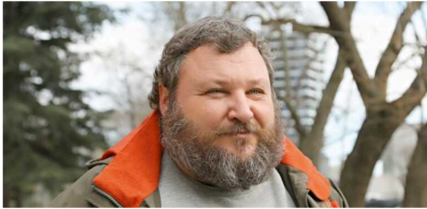
Дикий про мітинги на Івано-Франківщині: "Мені дуже не хотілося б, щоб Космач зачищали як ворожу територію"

Мешканці села Космач на Івано-Франківщині виступають проти повальної мобілізації. Екскомандир "Аїдара" Дикий заявив про можливість "зачистки" цього села.