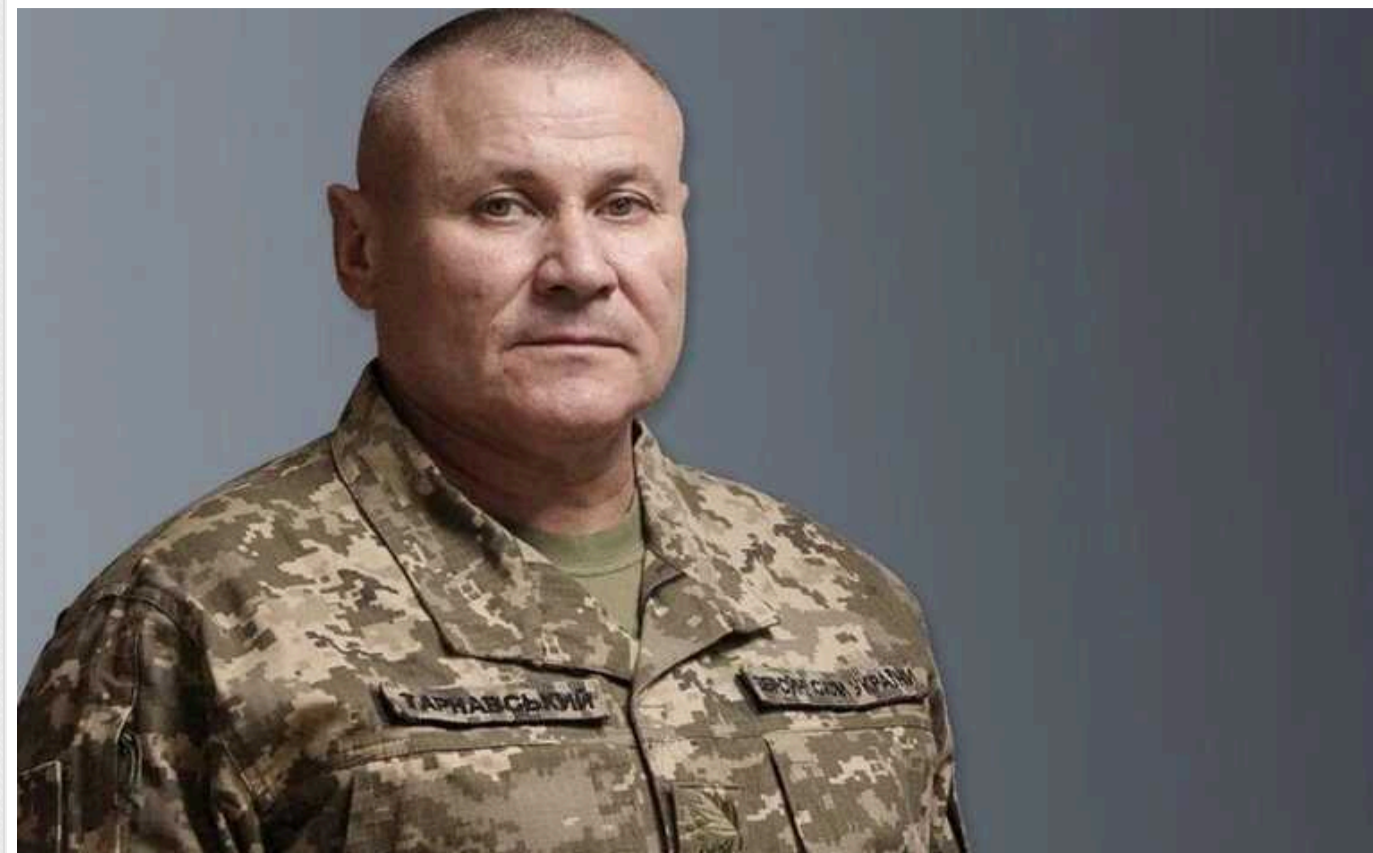
Ворог залучає бронегрупи до штурмів Авдіївки та Новомихайлівки, - Тарнавський

Російські окупанти залучають бронегрупи до штурмів Авдіївки та Новомихайлівки. Їх кидають на підтримку піхотних груп.