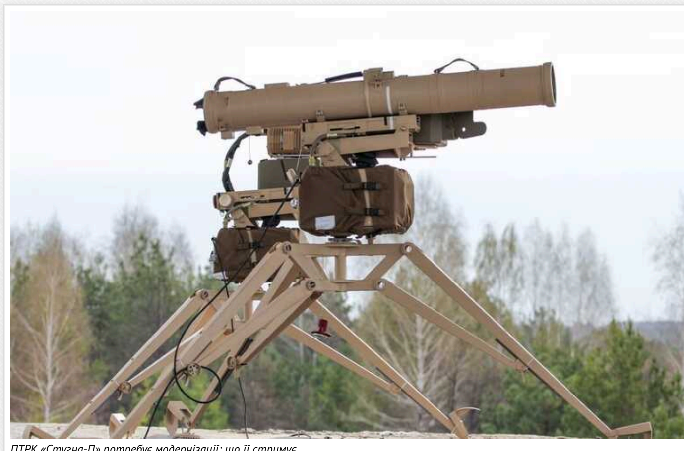
ПТРК «Стугна-П» потребує модернізації: що її стримує