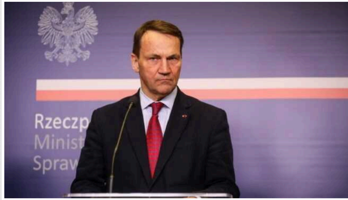
Якщо Путін переможе, то зрівняє Україну з землею та змусить українців воювати на своїй стороні, – глава МЗС Польщі Сікорський

Міністр закордонних справ Польщі Радослав Сікорський закликає не втрачати пильності щодо президента РФ Володимира Путіна. Російський диктатор руками своїх військових може зрівняти Україну із землею, тому йому не можна дати перемоги у цій війні.