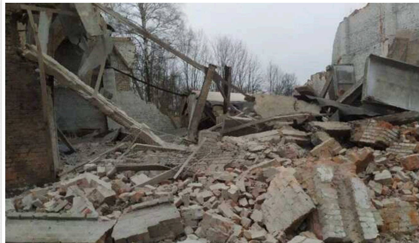
Окупанти за минулу добу завдали по Сумщині майже 200 ударів

Минулої доби росіяни не припиняли обстрілів населених пунктів Сумської області. Загалом нараховано 186 ударів.