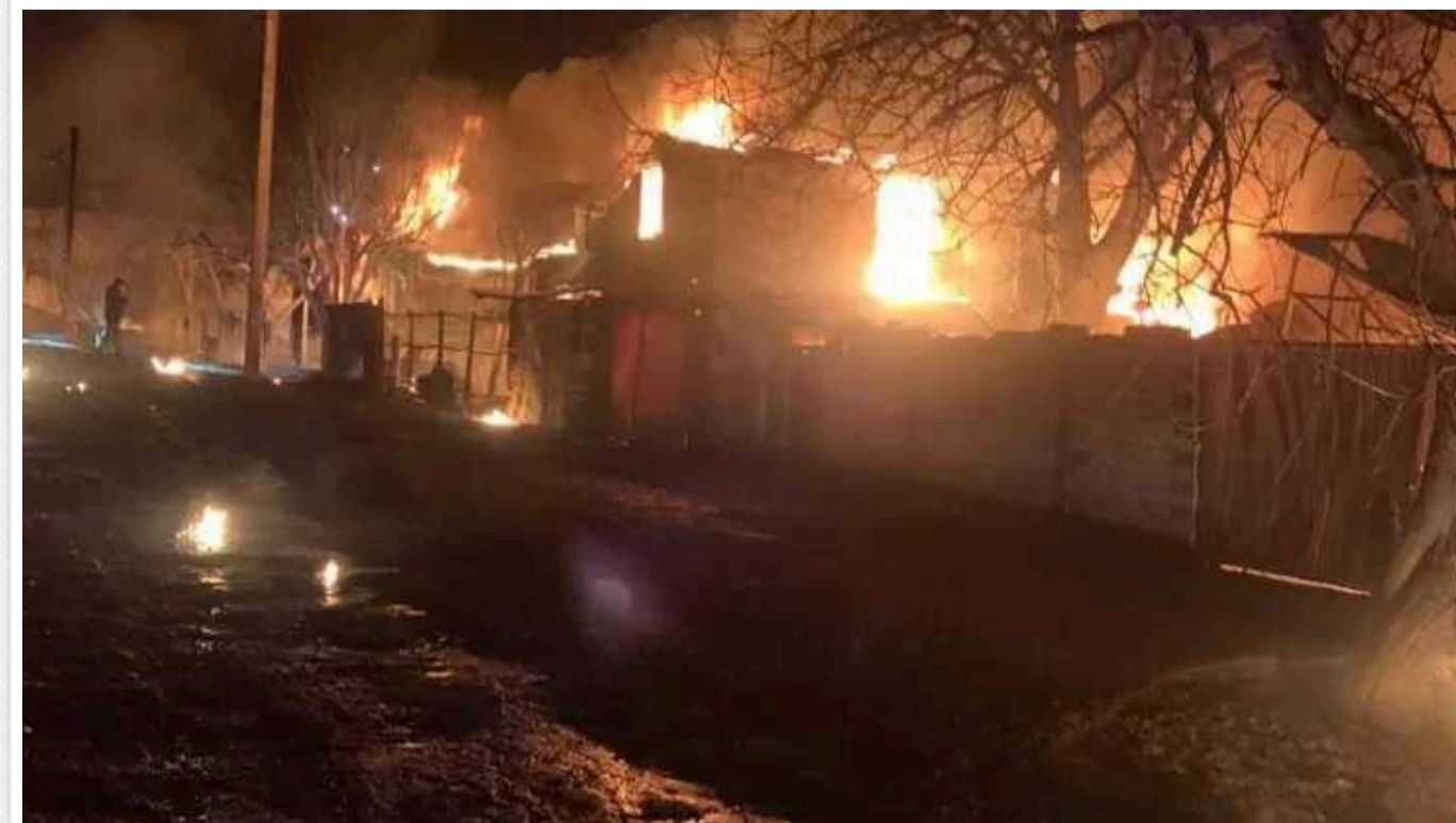
У Харкові оголошено День жалоби за загиблими від атаки окупантів: жертвами стали дві родини

У Харкові 11 лютого оголошено День жалоби за жертвами російської атаки, яку загартники влаштували напередодні. Ворожі "Шахеда" забрали життя двох родин.