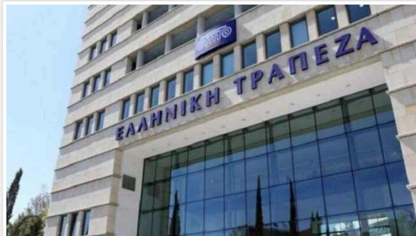
Один із найбільших банків Кіпру Hellenic масово закриває рахунки росіян

Сотні росіян, які проживають на Кіпрі, втратили свої рахунки в одному з найбільших банків острова Hellenic.