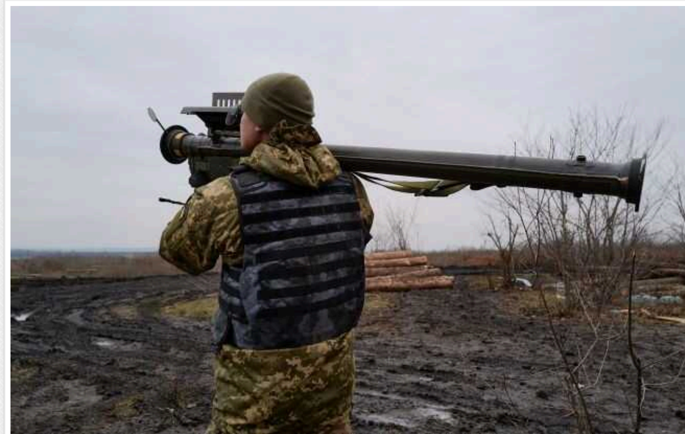
Окупанти вночі атакували Україну 45 "Шахедами": сили ППО знищили 40 дронів

Захисники неба України вночі 11 лютого відбили дранову атаку Росії, знищивши 40 із 45 ударних БПЛА типу "Shahed-136/131". Найбільше дронів ППО знешкодила на півдні, але був і "приліт".