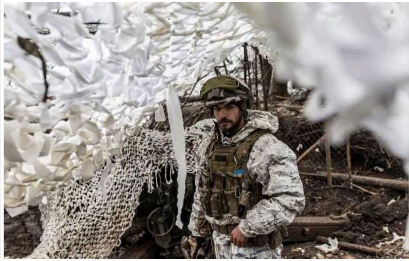
У ЗСУ назвали головний намір окупантів щодо Авдіївки: "Задум агресорів зрозумілий"

Російські окупаційні війська наразі зосереджують основні зусилля на Авдіївському напрямку, де хочуть встановити контроль над логістичними шляхами. Однак наші захисники дають гідну відповідь ворогу і посилюють свої позиції.