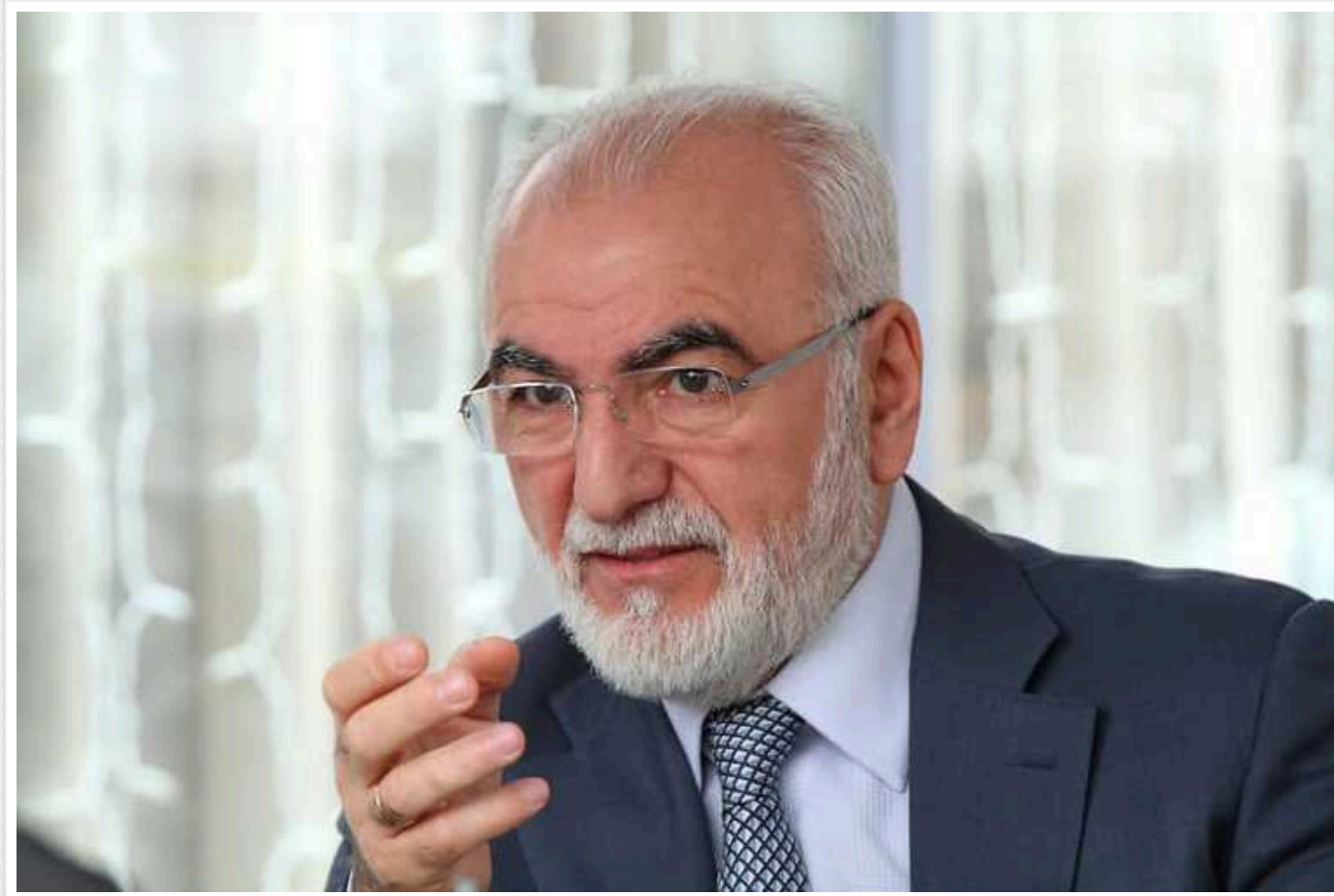
Суд заарештував українські активи російського олігарха Івана Саввіді та його дружини