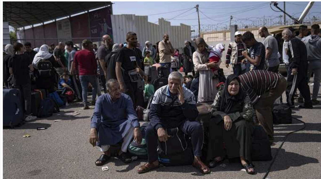
ЦАХАЛ обстріляла передмістя Рафаха: там сховалися біженці з Гази

Незважаючи на гучні заперечення США та мусульманських країн, Ізраїль, зважаючи на все, не має наміру відмовлятися від операції в палестинському місті Рафах.