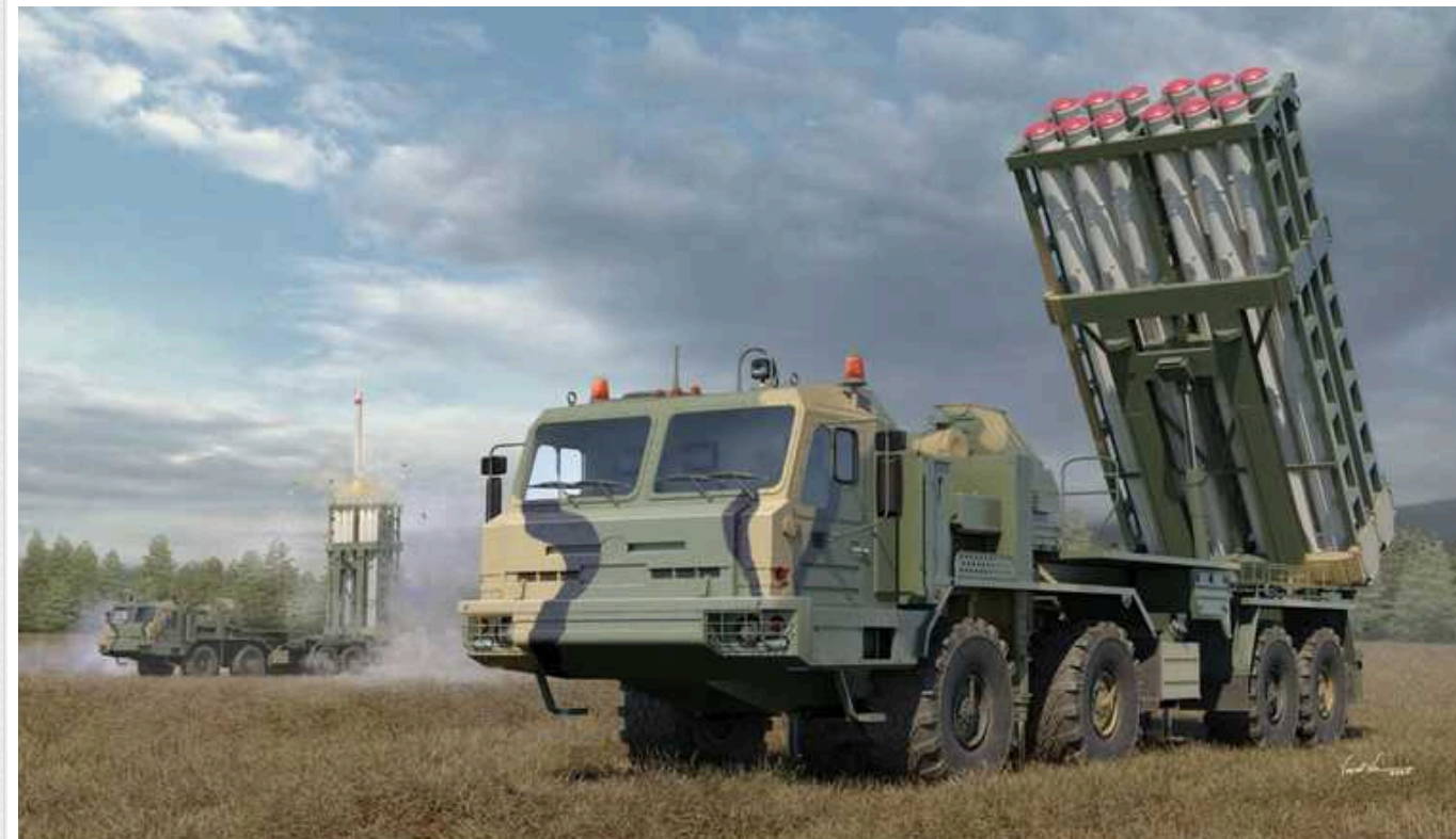
Окупанти підірвалися на власних мінах на новенькому ЗРК С-350 "Витязь"

Російські загарбники у Луганській області у лютому підірвалися на власних мінах. Окупанти прямували на новенькому 50П6Е ЗРК С-350 "Витязь".