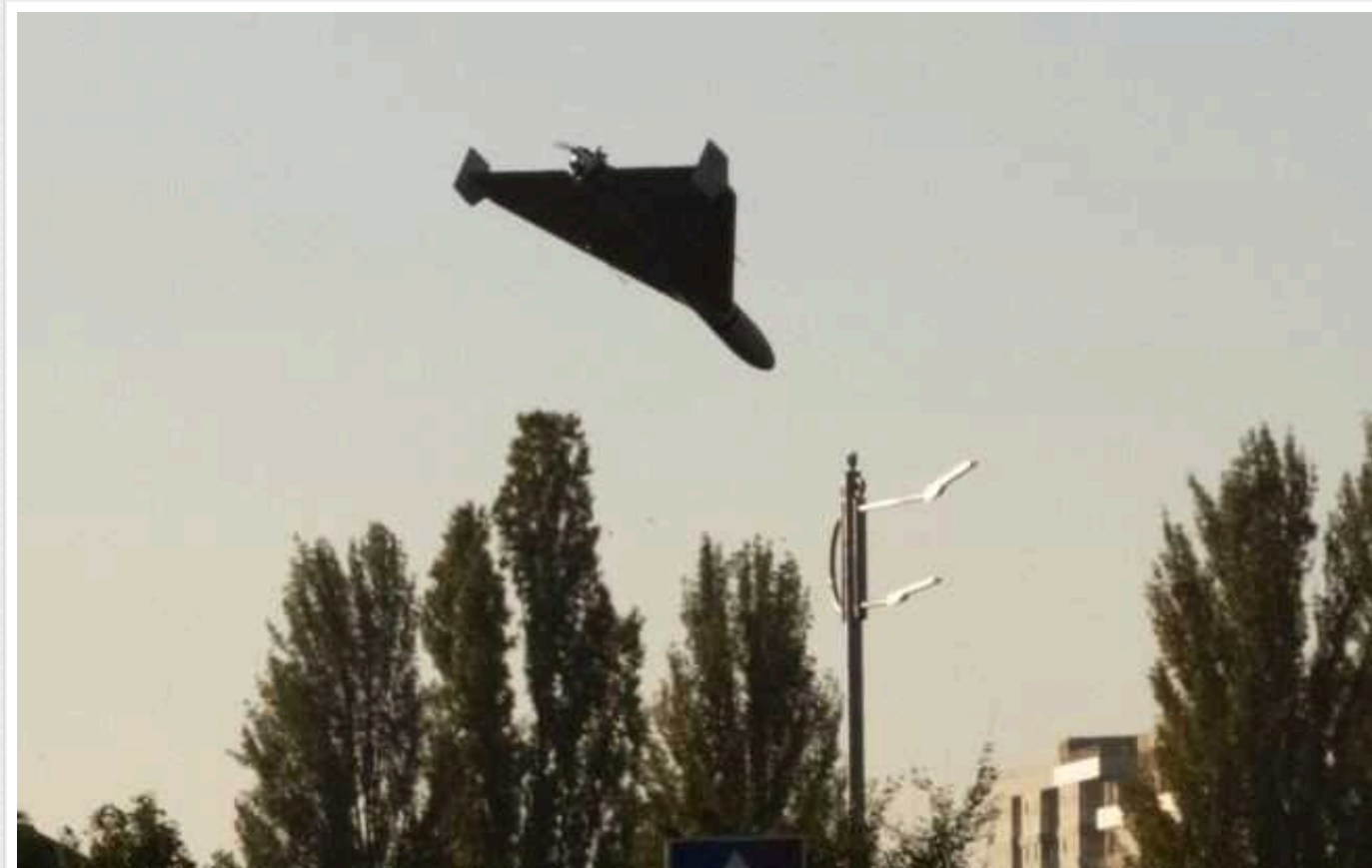
Окупанти знову запустили дрони: українців попередили про загрозу

Російські війська увечері 10 лютого запустили ударні дрони у бік України. Станом на зараз вони становлять загрозу для південних областей.