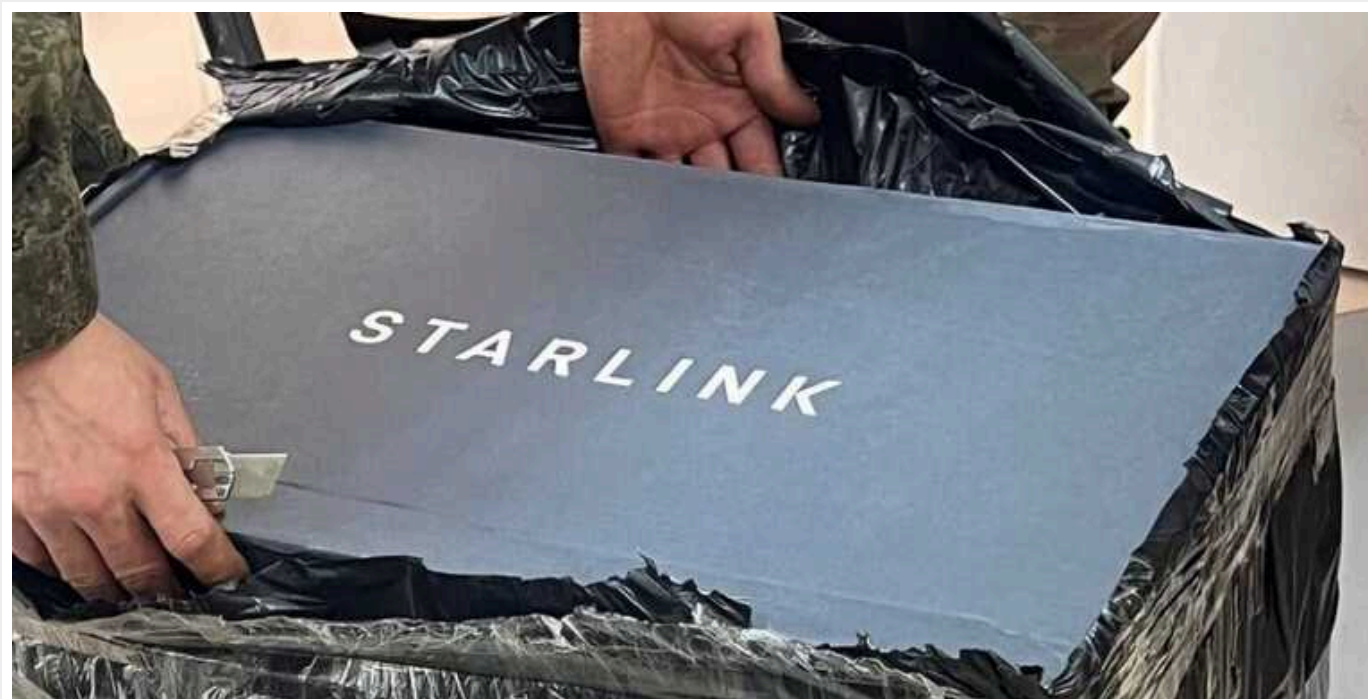
У ГУР підтвердили використання окупантами систем Starlink: "Це набирає системного характеру"

В Головному управлінні розвідки Міністерства оборони підтвердили використання російськими окупантами систем зв'язку Starlink від SpaceX. За словами Андрія Юсова, така практика набирає системного характеру.