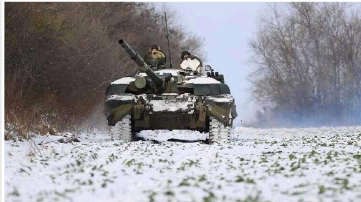
Ситуація на фронті: найважча ситуація на Авдіївському та Мар'їнському напрямках, ворог тисне

Російські війська не відмовляються від планів окупувати Україну, незважаючи на значні втрати. Сьогодні на фронті сталося 87 бойових зіткнень, а українські ракетні війська завдали ударів по трьох районах скупчення супротивника.