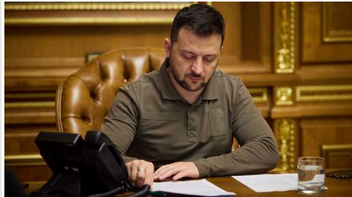
Зеленський провів переговори з Макроном: Україна отримає артсистеми "Цезар" і снаряди

У суботу, 10 лютого, президент України Володимир Зеленський провів телефонну розмову з французьким колегою Еммануелем Макроном. У межах Коаліції артилерії Париж виготовить і передасть Україні десятки артилерійських систем "Цезар", а також снарядів до них.