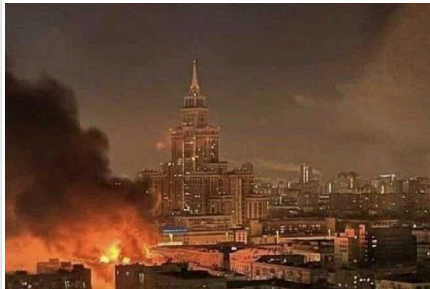
П'ять сценаріїв майбутнього Росії у 2030 році

Вашингтонський аналітичний центр "Атлантична рада" проаналізував п'ять сценаріїв того, якою може бути Росія у 2030 році. Хоч ці сценарії не вичерпні, автор звіту Кейсі Мішель вважає, що вірогідність саме такого розвитку подій найвища.