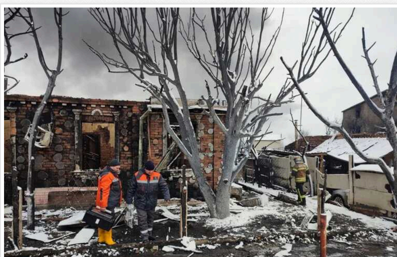
Що відомо про нічний удар ЗС РФ по Харкову: "Вулиця перетворилася на пекло"

За даними поліції, через атаку російських дронів повністю знищено 14 приватних будинків. Засинили кілька сімей, зокрема трое дітей.