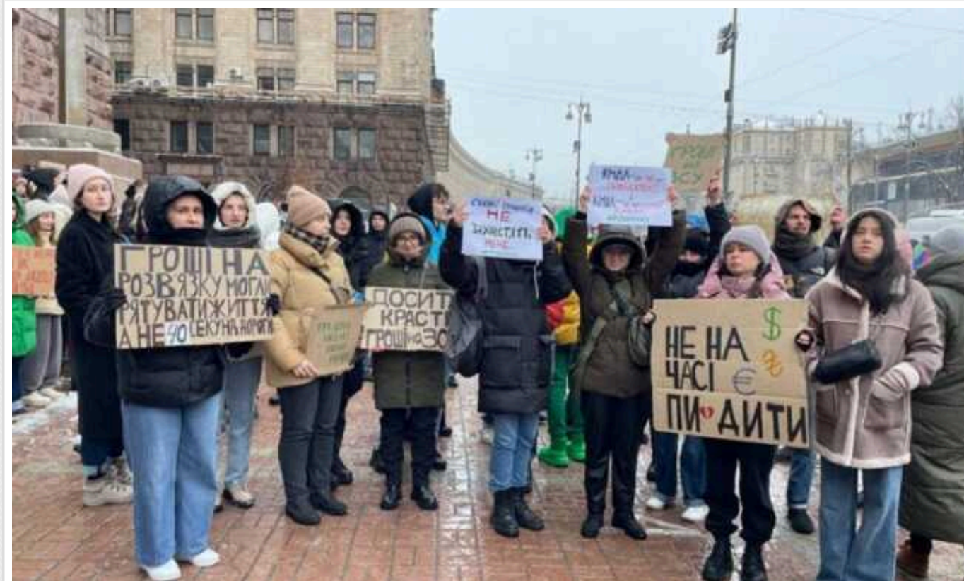
У Києві знову відбувся мітинг біля КМДА: вимагають виділити більше грошей на ЗСУ

У Києві зранку суботи, 10 лютого, під стінами Київської міської державної адміністрації (КМДА) кияни зібралися на другий у цьому році мітинг. Громадяни вимагали посилити фінансову підтримку ЗСУ із міського кошторису, збільшити фінансування закупівлі зброї та підвищити інклюзивність міста.