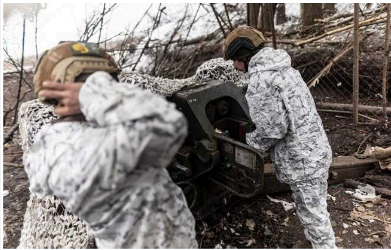
ISW: Українські воїни досягли підтверджених успіхів у Кринках