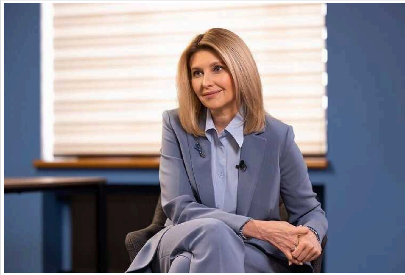
7 найоригінальніших брошок Олени Зеленської та що вони означають

З початку повномасштабної війни перша леді України Олена Зеленська стала доповнювати свої костюми "промовистими" брошками. Як правило, це – вінтажні прикраси чи прикраси з прив'язані у вітчизняних виробників. Усі вони – не просто частина образу, а маленькі меседжі миру.