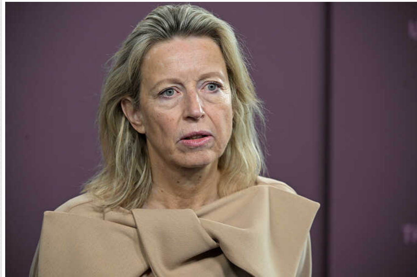
Військова допомога Україні не повинна мати обмежень, - міністерка оборони Нідерландів

Очільниця Міністерства оборони Нідерландів Кайса Оллонгрєн закликала до посилення військової допомоги Україні у контексті повномасштабного вторгнення Росії. Від цього також залежить безпека Нідерландів.