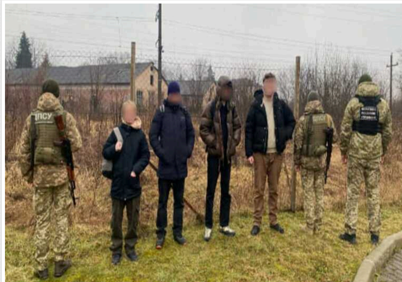
Прикордонники на Закарпатті затримали 8 ухлянтів: планували по горах дістатися до Словаччини

Прикордонники відділу «Новоселиця» Чопського загону викрили 8 ухлянтів з різних областей України, які намагалися гірською місцевістю пробратися у Словаччину. На затриманих складуть адмінпротоколи.